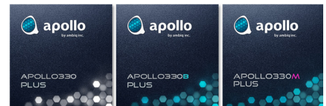
Apollo330 Plus, Apollo330B Plus, and Apollo330M Plus 1

TrustZone®技術に基づく革新的なsecureSPOT®3.0機能が、Apollo330 PlusシリーズSoCをさらに強化し、接続されたデバイスが送信および処理するデータの整合性と機密性が確保されます。セキュアブートやセキュアファームウェアアップデートなどのハードウェアベースのセキュリティメカニズムにより、これらのSoCは不正アクセスや悪質な攻撃に対する強固な保護を提供し、さまざまなアプリケーションへのセキュアな導入を可能にします。